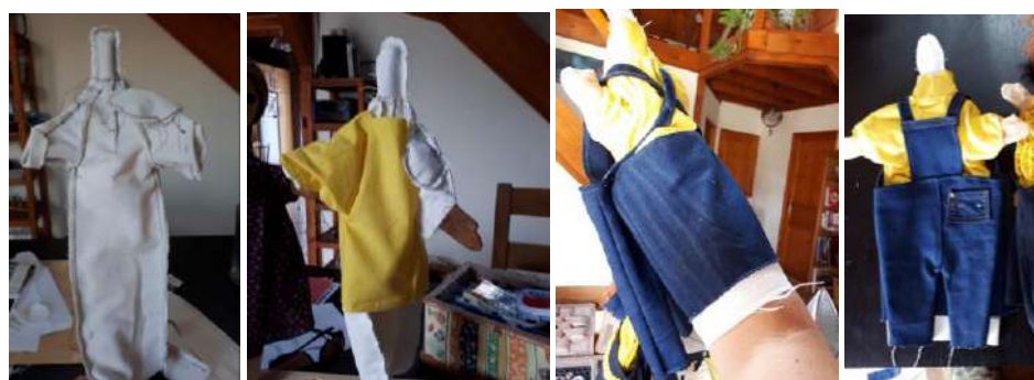
Couture de la gaine et de l'habit de Youri