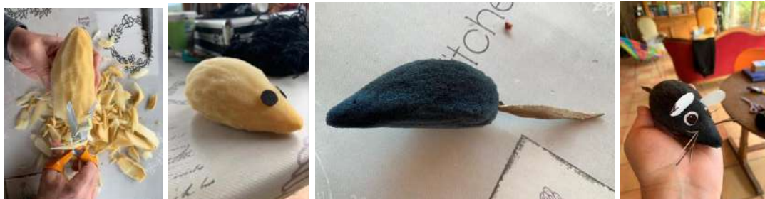
Naissance d'une souris

Marionnettes, décors, accessoires... tout est « Made in Théâtre Talabar »