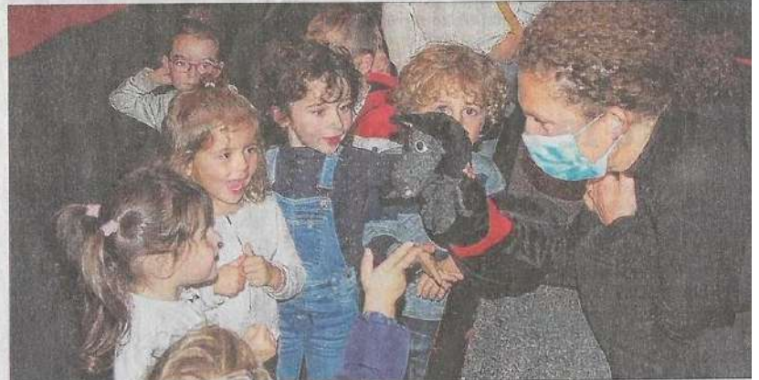
À l'issue du spectacle, les petits ont voulu découvrir les héros de leur histoire.

à la portée des enfants à partir de 3 ans, qui a su galvaniser et réveiller l'âme et le cœur des plus grands.