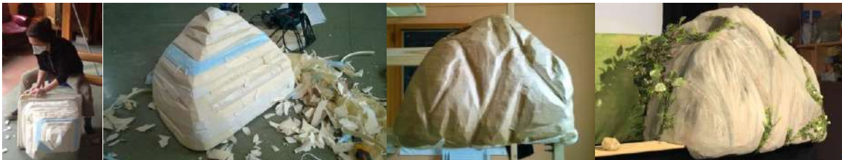
Les étapes de réalisation de la grotte